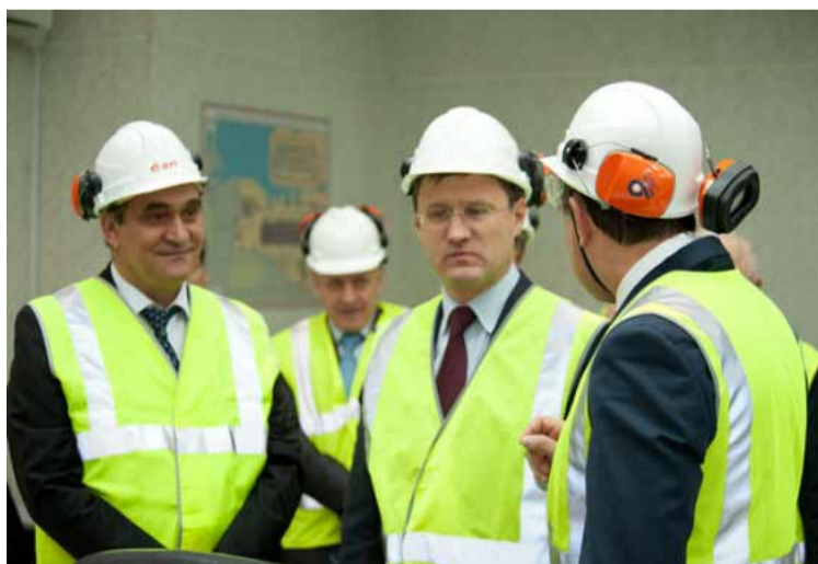
А.Новак с сургутскими энергетиками

*** В Югре доля невовлечённых запасов колоссальна. Она оценивается экспертами на уровне 8 миллиардов тонн. «53% открытых и разведанных месторождений до сих пор не введены в разработку. Цифра нефтезапасов, о которых мы говорим, составля-