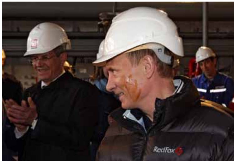
В.Путин на месторождении имени Корчагина

В начале 2015 года хотелось угостить вас каким-нибудь из ряда вон оптимистичным прогнозом, эдакой сногшибательно хорошей новостью, чтоб настроение взмыло вверх и все радостно заулыбались. Но... перерыв весь Интернет, такого «цветочка аленького» не нашла - до безудержного оптимизма всё же далеко. Как ни крути, а всё отталкивается от реалий дня сегодняшнего. А они таковы: цена на нефть продолжает балансировать. Но хорошая новость уже в том, что ничего сверхординарного не происходит. Разве мы это не проходили, разве нам впервой переживать такие времена? Больше того, как бы парадоксально ни прозвучало, но практика показывает: именно после таких сложностей экономика наша укрепляется. Да и прогнозы, по сути дела, не так уж плохи.