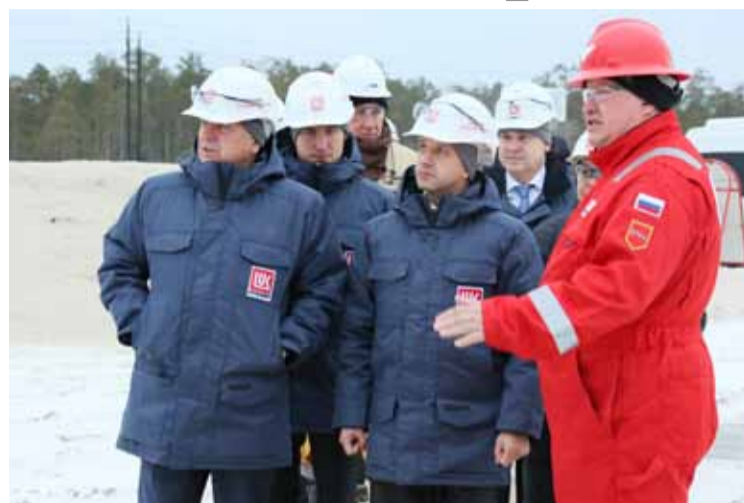
В.Алекперов и А.Дворкович на Южно-Кустовом месторождении «Когалымнефтегаза»

Разделяет точку зрения министра энергетики и первый заместитель Председателя Правительства РФ Аркадий Дворкович: «Наш прогноз - сохранение добычи на стабильном уровне, но для этого необходимо многое сделать - как в части обеспечения финансирования, замещения части оборудования, особенно по трудноизвлекаемой нефти, так и по вводу в эксплуатацию новых участков. Во многом