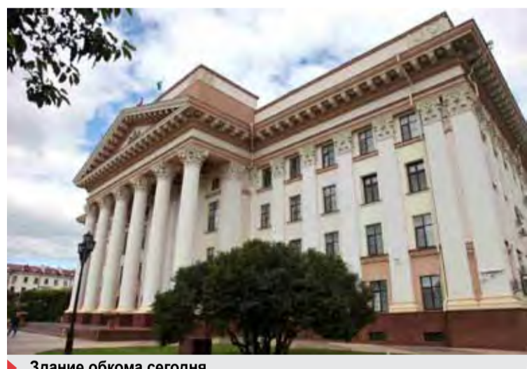
► Здание обкома сегодня