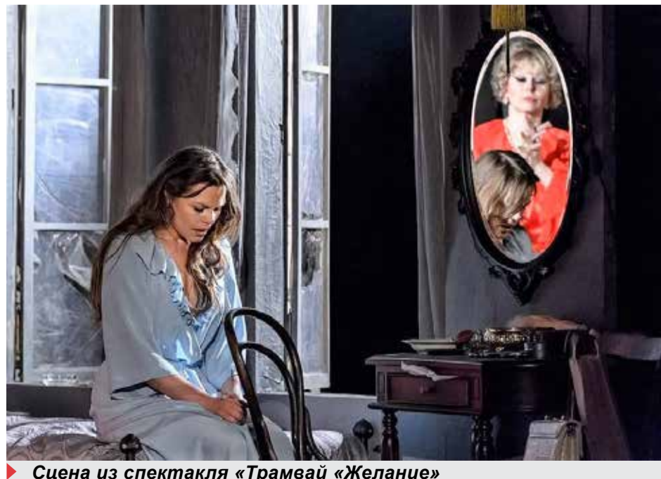
▶ Сцена из спектакля «Трамвай «Желание»

Обязательно! Мы планируем возобновить то, что начали в первом когалымском сезоне. Всё, что было намечено и обещано, выполним, и эта работа начнётся с марта: мастер-классы, которые с охотой воспринимались зрителем,