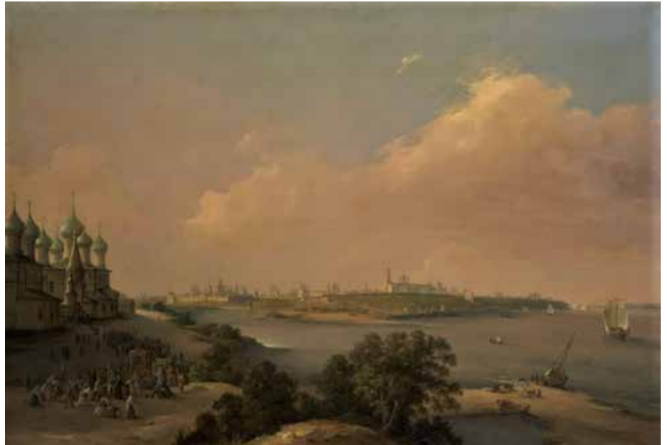
► Н. Чернецов. «Вид города Ярославля»

В 1851 году Чернецовы представили панораму царю в расчёте на материальное вознаграждение, в котором очень нуждались. Кроме того, они надеялись, заручившись одобрением царя, издать свои материалы. Однако Николай I ограничился благим пожеланием, чтобы любители изящного оценили и поддержали «труд достойных художников», и не отпустил ассигнований на издание. При этом царь также отклонил ходатайство Академии художеств об увеличении денежного содержания Григорию и назначении такого же содержания Никанору. Разбогатеть художникам не удалось, оба умерли в бедности.